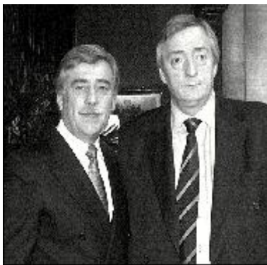
08/08/03 Diario Río Negro

En RN, el proceso señalado, no favoreció al candidato del PJ porque, al tener este grado de maniobrabilidad, o sea, N. Kirchner al no estar ligado a la estructura nacional, realizó un juego pendular con Carlos Soria y Eduardo Rosso. Si por un lado el PJ nacional apoyaba a los candidatos oficiales del PJ provincial, el presidente jugaba con E. Rosso. Esto se puede ver a través de diversas fotos y en reuniones. Debemos resaltar que los procesos en política no son neutros dado que producen efecto político.