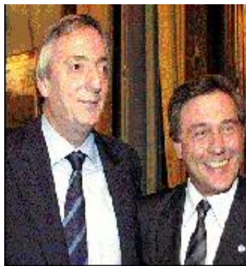
13/08/03 Diario Río Negro