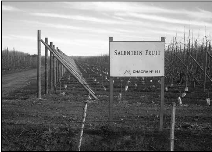
Fig. 3. Chacra propiedad de Salentein Fruit, Guerrico.