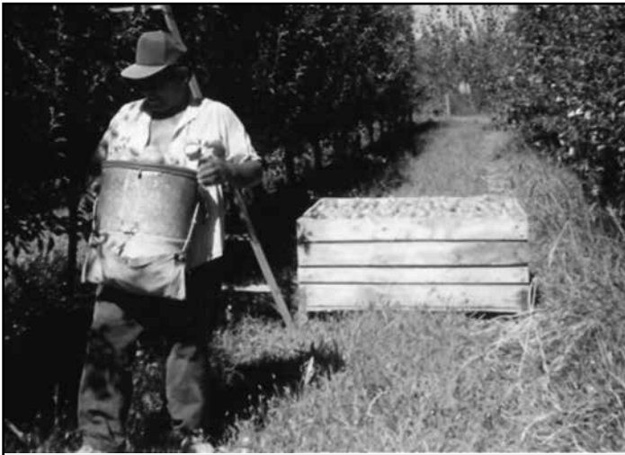
Fig. 4. Cosechador de peras.