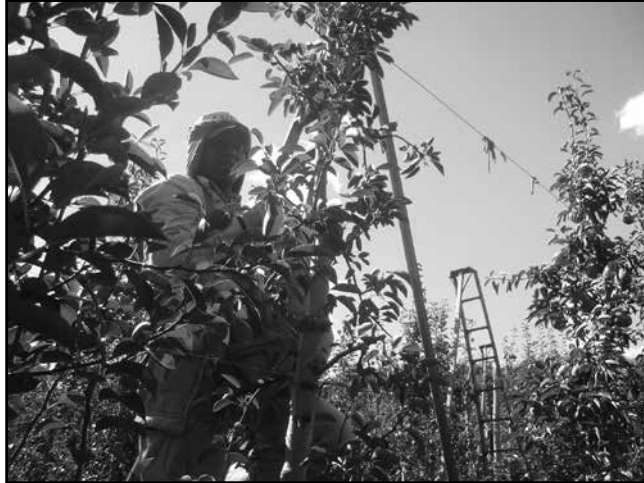
Fig. 1. Trabajador norteño trabajando.

Sobre la heterogeneidad del mercado de trabajo avanzaré en el siguiente capítulo.