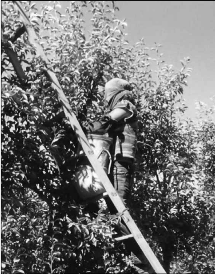
Fig. 5. Cosechador tucumano.