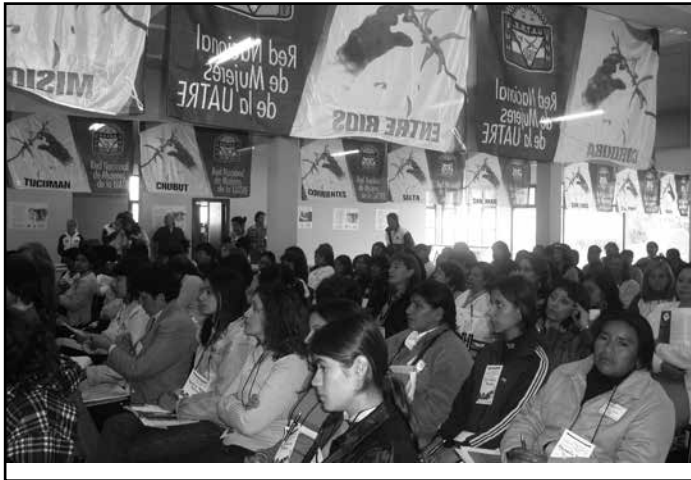
Fig. 6. Mujeres del país en el Encuentro Nacional de la Red de Mujeres de la UATRE.