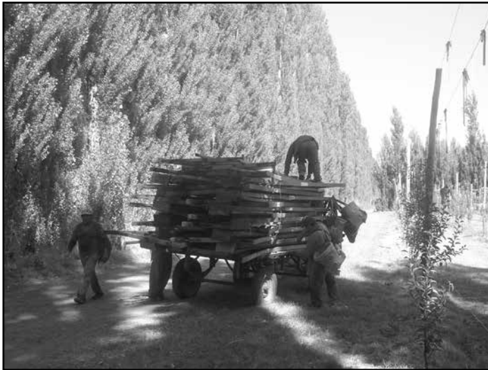
Fig. 7. Traslado de escaleras para la cosecha.