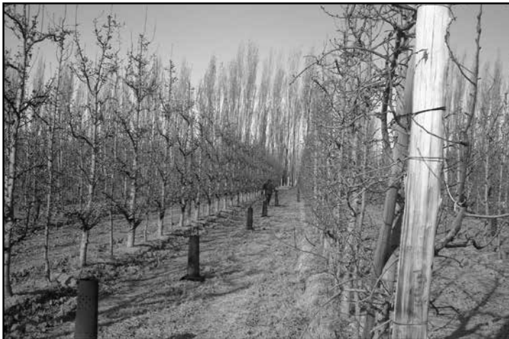
Fig. 2. Trabajador acomodando los calefactores para mitigar las heladas.