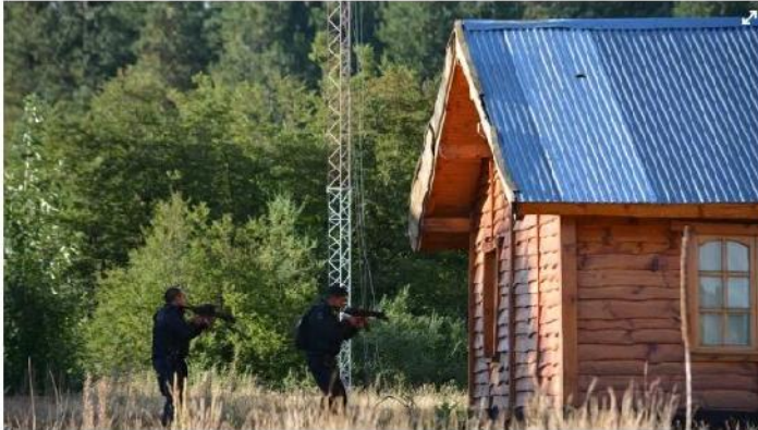
La policía busca al femicida en las casas de su numerosa familia.