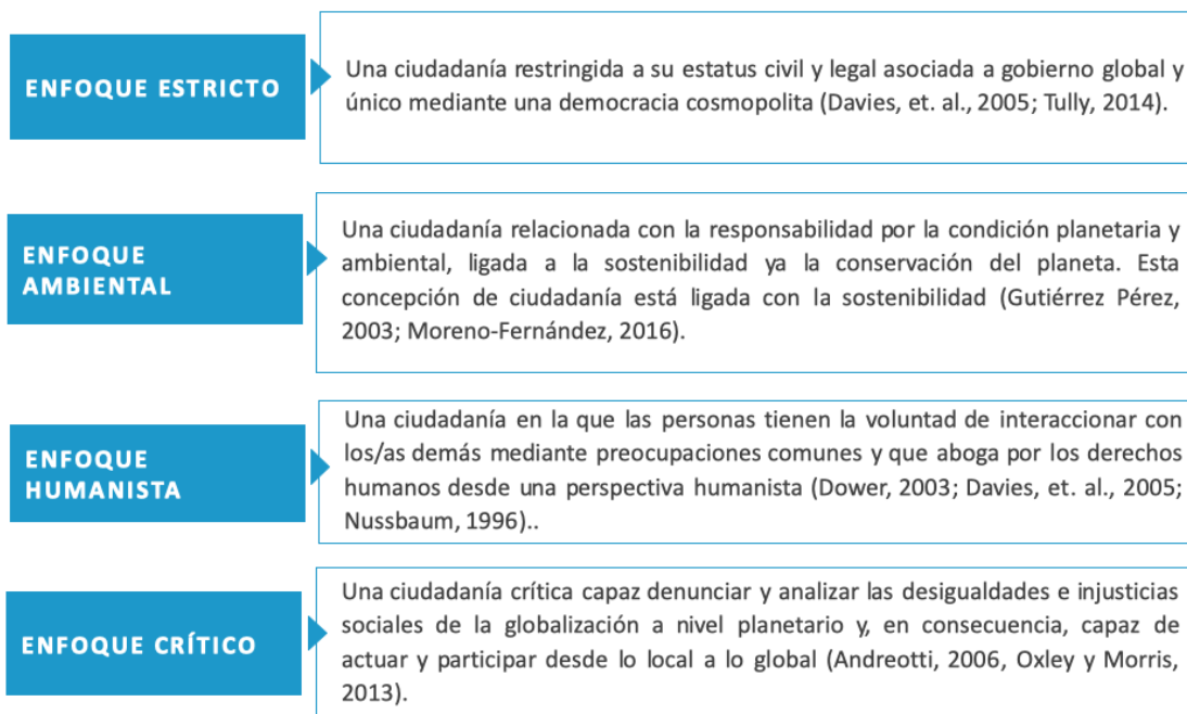
Esquema 1. Concepciones ciudadanía global. Fuente: Elaboración propia en base autores citados.