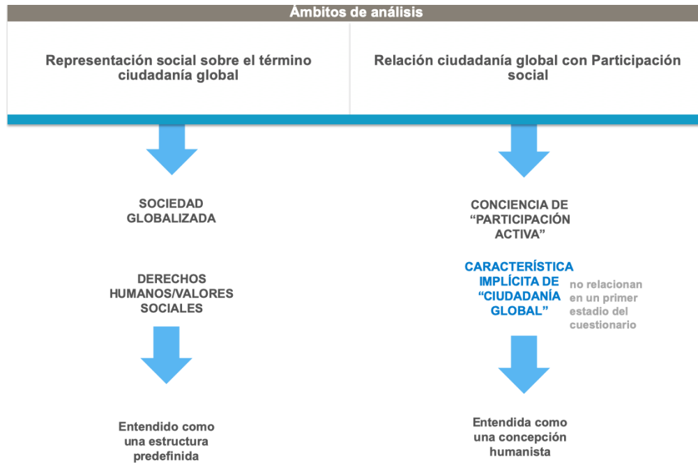
Esquema 1. Categorías generales análisis datos.